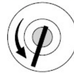
モードスイッチの位置